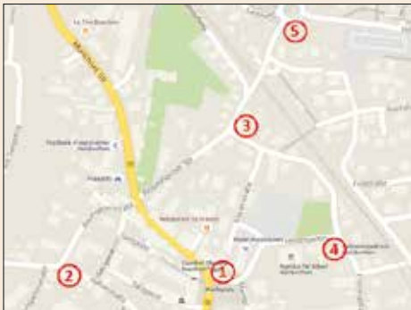
1 Altes Rathaus, 2 Hafnerstraße 8, 3 Frühlingstraße 2, 4 Frühlingstraße 14, 5 Industriestraße 53

Die Polizeiarbeit hat in Holzkirchen eine lange Tradition. Die Industriestraße 53 ist die fünfte Adresse einer Polizeistation in Holzkirchen.