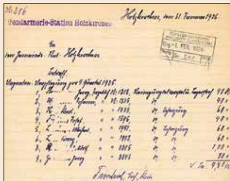
Rechnung von 1926

Eine Gebührenaufstellung vom 31. Januar 1926 zeigt, dass die Insassen für den Aufenthalt im Arrest auch damals schon selber zahlen mussten. Immerhin 40 Pfennige im Quartal. Für Beheizung wurden 20 Pfennige extra fällig. Das Geld ging zur Hälfte an die Gemeindegasse und zur Hälfte an die Reinigungskraft. Das Dokument aus dem Gemeindearchiv ist in der Vitrine ausgestellt.