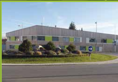
Holzkirchner Polizei im Wandel der Zeit