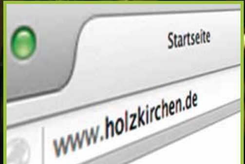
Holzkirchens neue Web-Präsenz